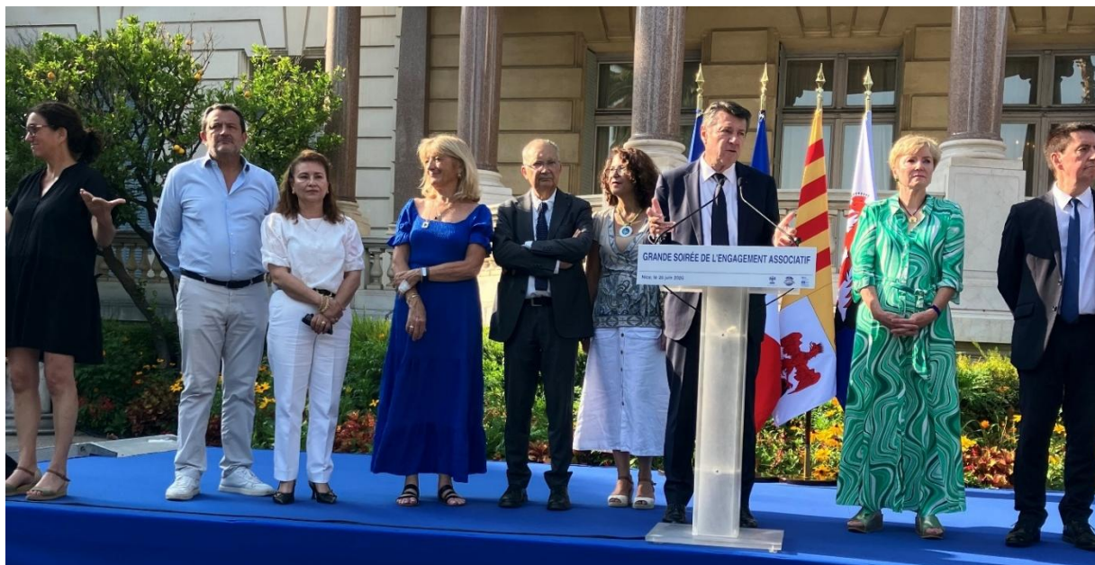
Notre Maire, Christian ESTROSI entouré de ses adjoints, durant son allocution